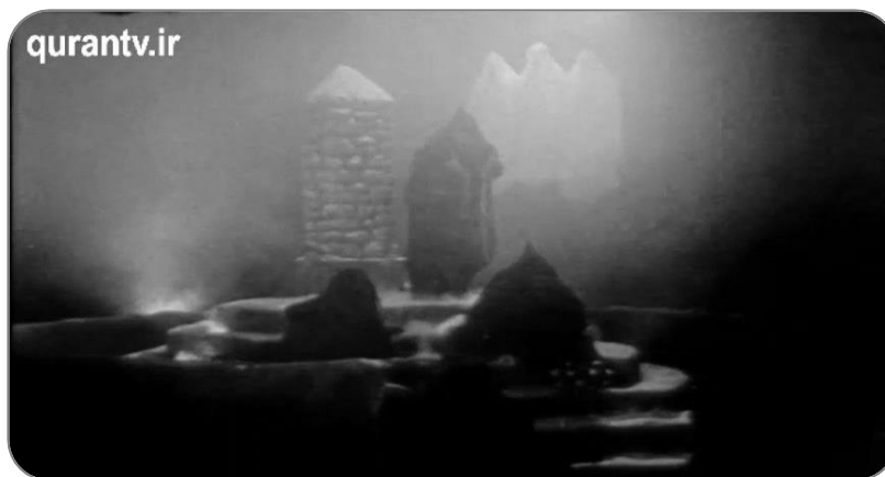
تصویر ۲-۳ فرشتگان از طرف خداوند با ابلیس گفت و گو می کنند.